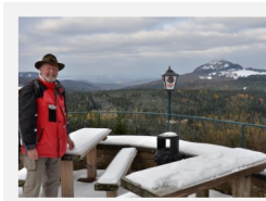
Blick zur Milseburg

Erste Station ist die Enzianhütte (760m Höhe). Hier rasten wir lediglich für eine kurze Zeit.